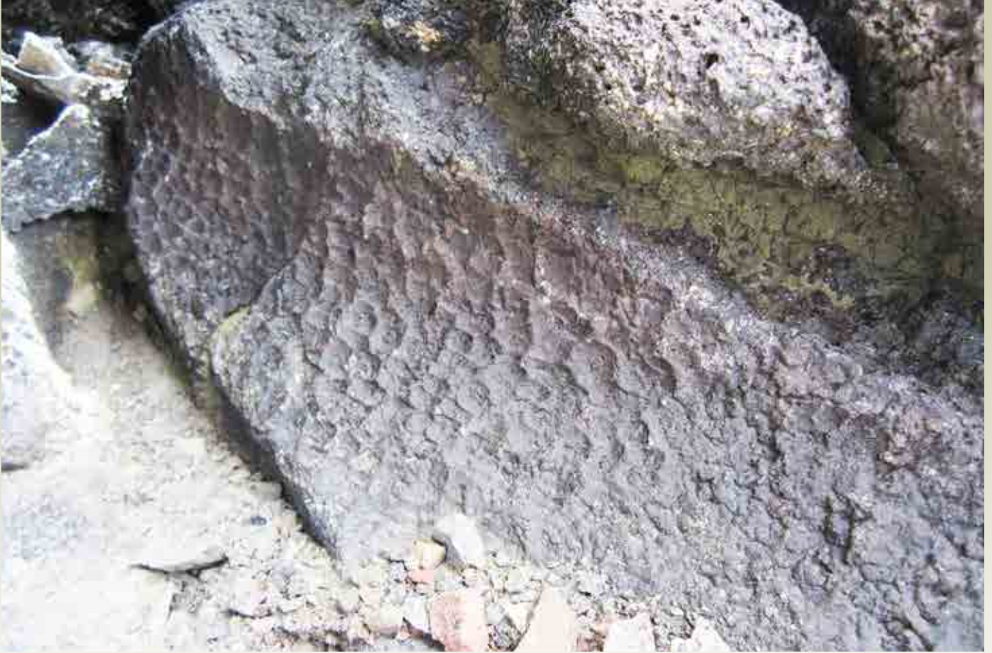
Mynd 5: Nærmynd av einum avriti av bærkinum á einum uppkolaðum viðarbuli. Myndin er frá Gróthúsurð á Sandi.