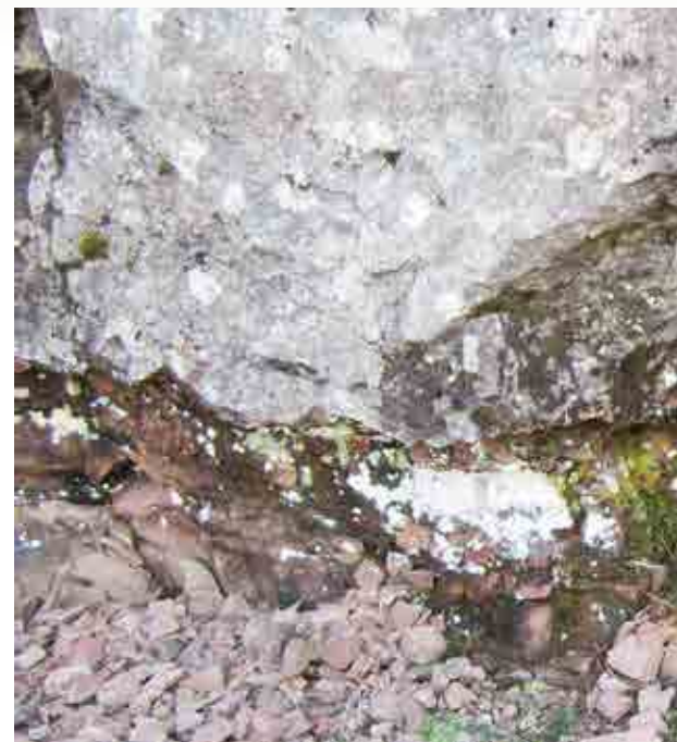
Mynd 4: Avrit av fornum viðarbuli, ið varð kolaður upp av grótbræðingini, sum floymdi út yvir skógarvaksið lendi. Avritið er umleið 30 cm breitt og ein góðan metur til longdar/dýpdar. Myndin er frá vegskurðinum við Sundsháls uppi á oyggjarvegnum á Streymoynni.

Steinrenningar, sum eru at finna í føroysku fláarøðini, kunna í høvuðsheitum býtast í tveir bólkar. Tann fyrri bólkurin er at finna í legugróti („royðugróti“) millum tær meira føstu basaltfláirnar. Royðugrót er harðnað bland av legugrýti, sum stavar bæði frá eldgosum (gosøska) og tærdum basalti og øðrum leysum tilfari, leiri, sandi og grúsi, sum er borið við vindinum ella skolað við áum út á sjógv ella í vøtn. Vanligastu steinrenningarnar í hesum førum eru avrit av bløðum ( sí mynd 2 og 3 ) og øðrum plantuleivdum. Hesar steinrenningar finnast bæði sum avrit, har einki er eftir av plantuni