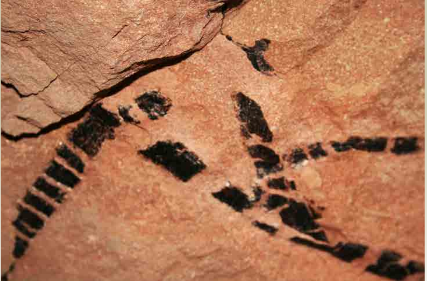
Mynd 3: Steinrunnin bløð í loftinum á “zeolittholuni” í Nólsoy. Avritini eru hvørt sær umleið 50 cm long og eini 7 cm breið, har tey eru breiðast. Steinrenningarnar síggjast sum ein tunnur svartur kolfilmur í tí reyða royðugrótinum.