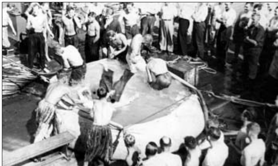
Ein stórhending á ferðini var tann sokallaði linjudópurin, tá farið varð um ekvator. Her gongur tað lívliga fyrri seg!

boð um, at vit allir skuldi mæta upp umborð á "Willem Barendsz" kl. 7 morgunin eftir.