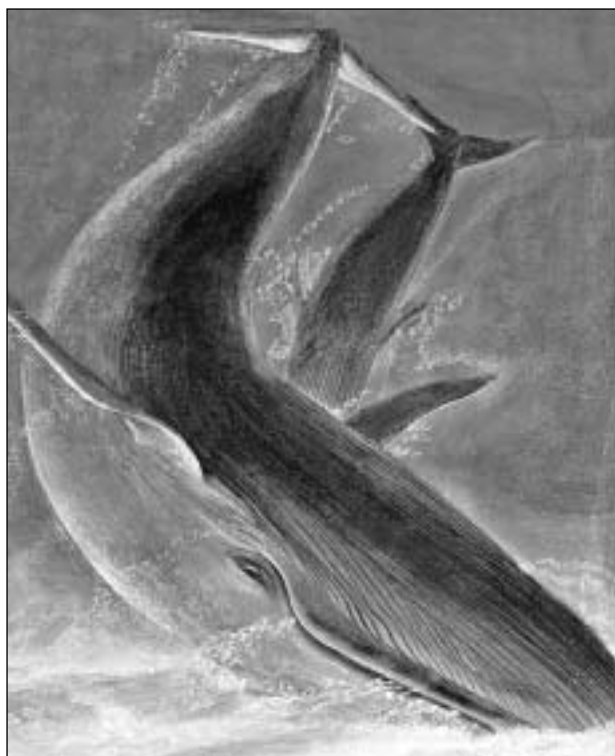
Royður, ella bláhvalur, var týðningarmesti fongur-in hjá hvalaveiðumonnunum.

18. februar var arbeitt sum vanligt alla náttina. Nú eru vit komnir upp um 400 hvalir. "Am.1" hevur fingið 52, "Am.2" - 65, "Am.3" - 92, "Am.4" - 92, "Am.5" - 47, "Am.6" - 44, "Am.7" - 8, "Am.8" - 21, tilsamans 421 hvalir.