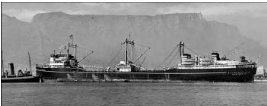
Her eru teir inni í Cape Town.

At taka úr blaðnum Síðurnar 11, 12, 17 og 18 eru samhangandi og kunnu takast úr blaðnum