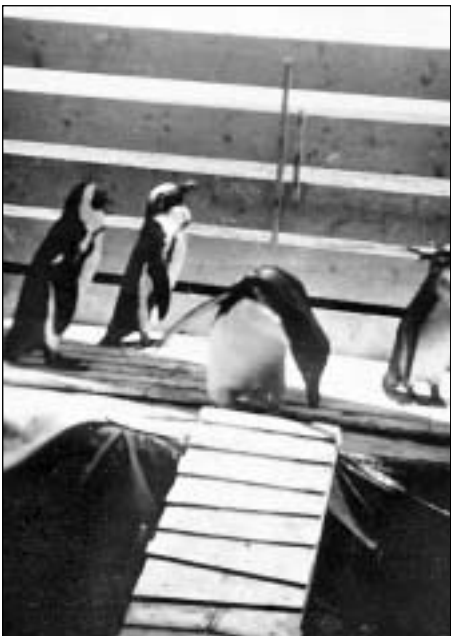
Pingvinir vóru hildnar sum pisur.