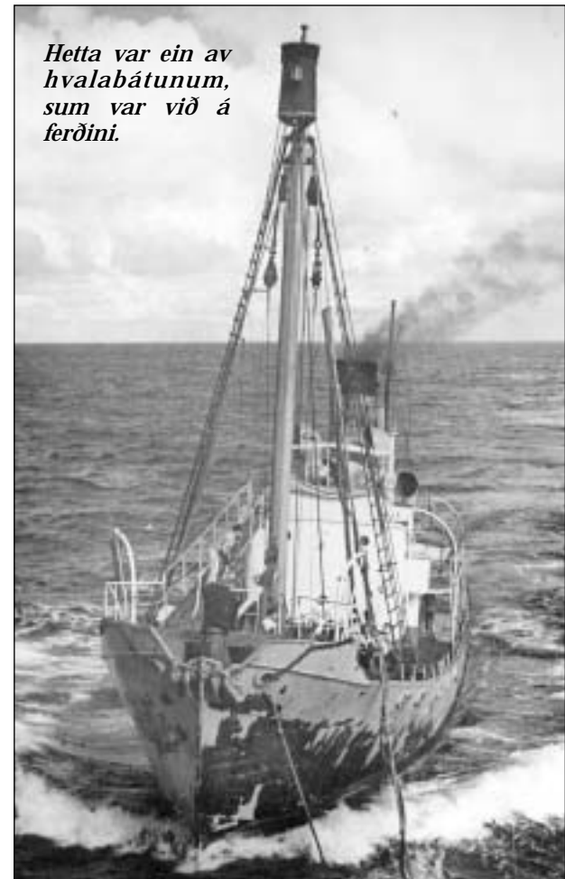
Hetta var ein av hvalabátunum, sum var við á ferðini.