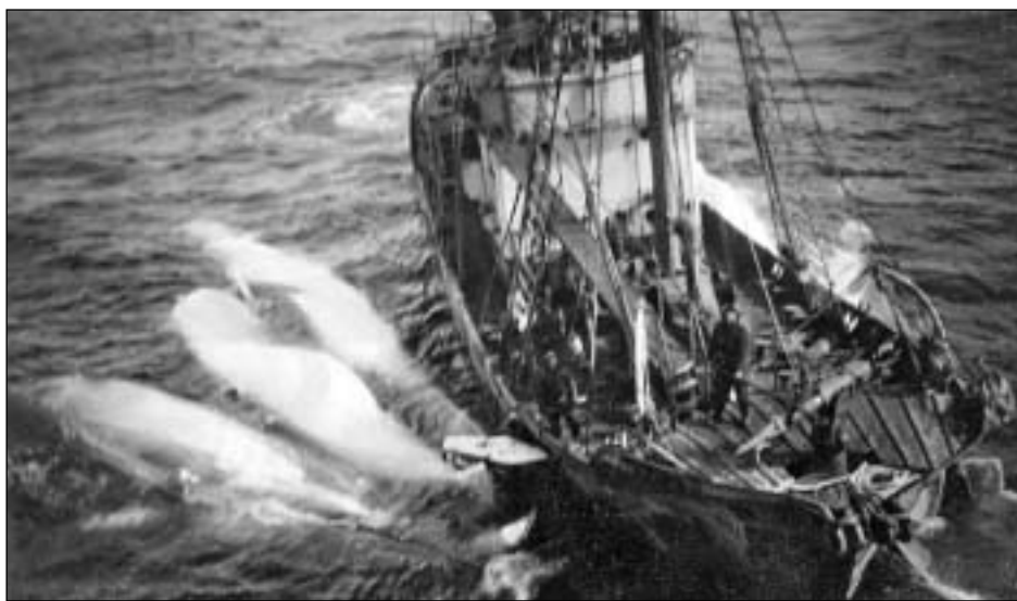
Hvalabátur inn við fongi.