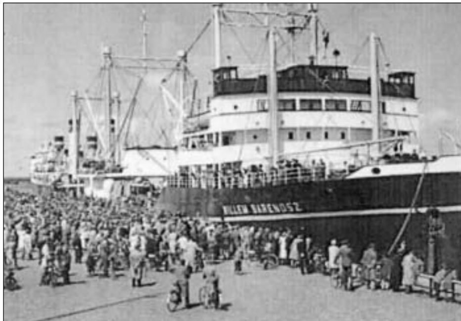
"Willem Barendsz" var bygdur sum oljutangaskip í Gøteborg í Svøríki í 1931. Støddin var 10.409 t. Longdin var 155 m, breiddin 20 m. og dýpdin 9,5m. Maskinorkan var 2 x2400 hk B&W. Skipið varð í 1945 keypt til Hollands og bygt um til hvalaskip. Sum tað sæst var forvitenskapurin stóru. Nógv fólk á bryggjuni.

Sunnudagin 13. oktober vóru vit í friði á sjómansheiminum. Tá fingur vit