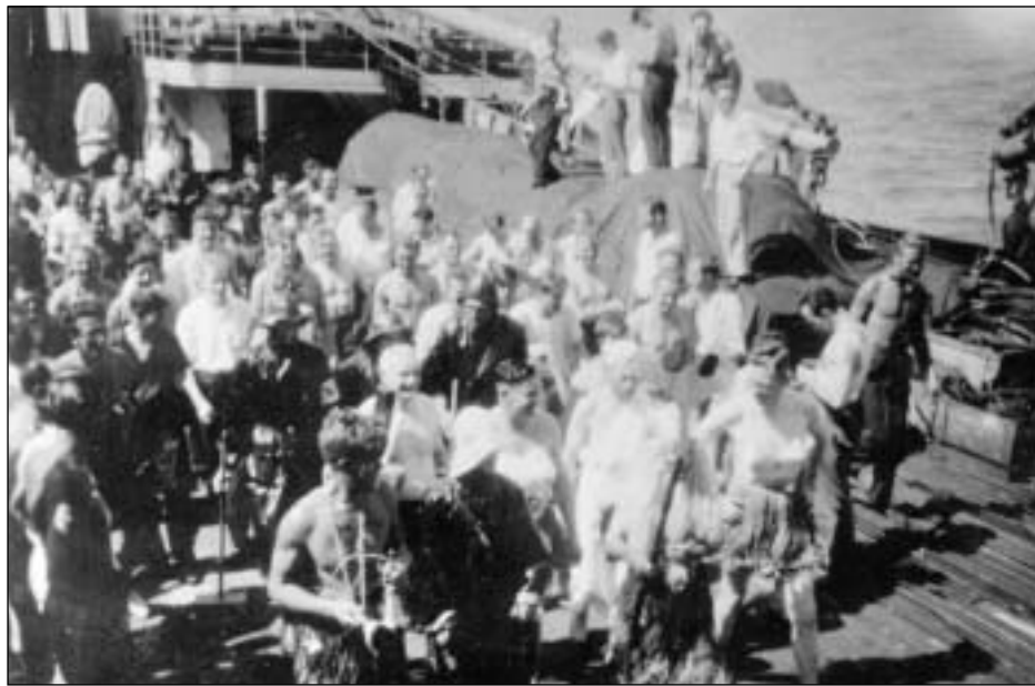
Hvør maður á dekkinum.

10. november Sunnudagin 10. november - tíðliga á morgni - sóu vit tær Kanarisku oyggjar. Teir triggir hvalabátarnir, sum vóru eftir í Southampton, sigldu hagar frá hómorgunin. Um kvöldið høvdu vit mist landið úr eygsjón. Um kvöldið var togtogan á dekkinum millum føroyingum og hollendarar. Før-