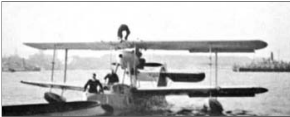
Flogfar varð eisini nýtt til at leita eftir hvali.

10. januar kl. 8 um morgunin kom "Am. 7" á bordið at fáa sær útgerð umborð. Vit vóru lidnir við hann kl. 4 um dagin. Tá kom "Am. 8" at bordið at fáa sær sína útgerð, hann var ikki liðugur okkara vakt. "Am. 7" fór frá, og vit tóku tann hvalin, hann hevði, uppá dekkið og