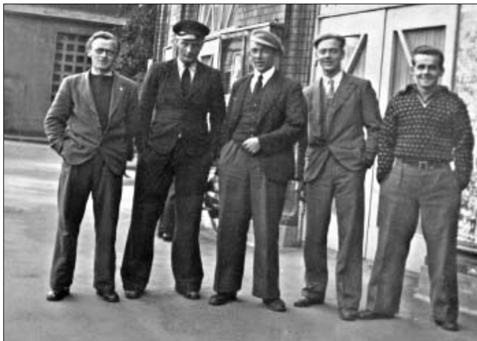
Aftur í Keypmannahavn.

"Rommel" kom til Havnar eftir okkum, men tá teir skuldu fara út aftur til Nólsoyar, brutu teir krumtapsaksilin, so teir noyddust at lata seg sleipa til Nólsoyar av stórabáti.