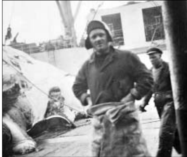
Herlon í Kálvalið, sum eigur sín part av hesi frá-søgn, stendur aftanfyrri. Tann fremri er helst ein canadiari.