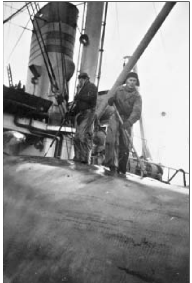
Ein rættiligur stórhvalur er innkomin og nú verður farið at flensa.