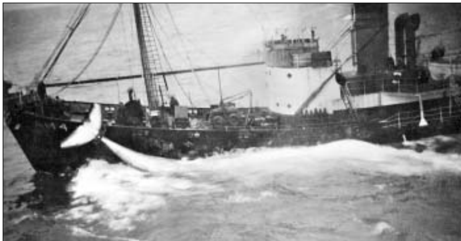
Hvalabátur við nebbafiski.