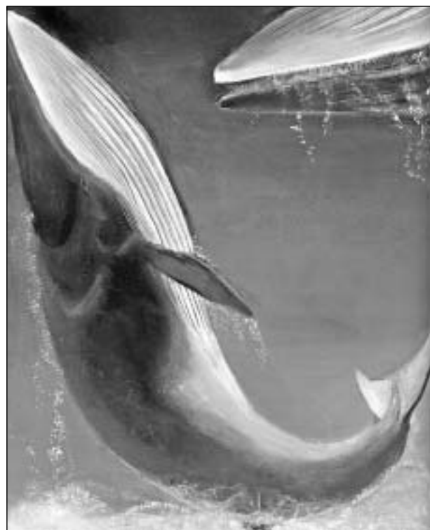
Nebbfiskur varð eisini veiddur.