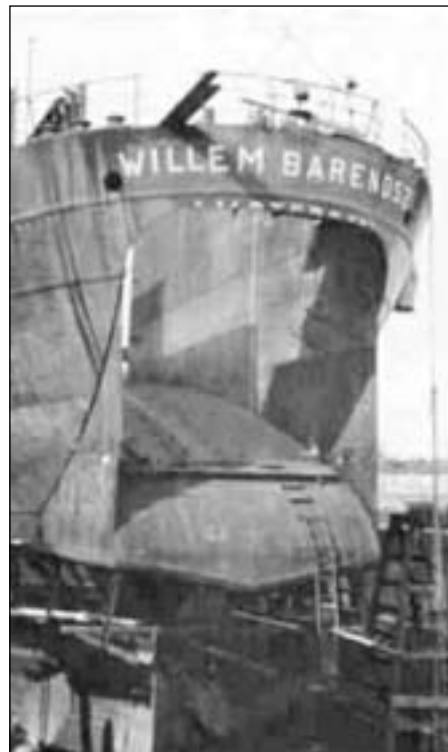
Hekkan á "Willem Barendsz".