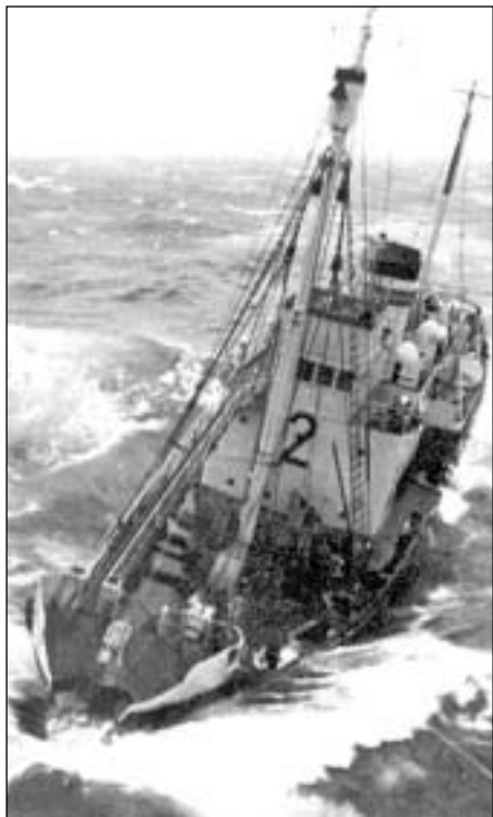
Hvalabáturinn "AM 2".