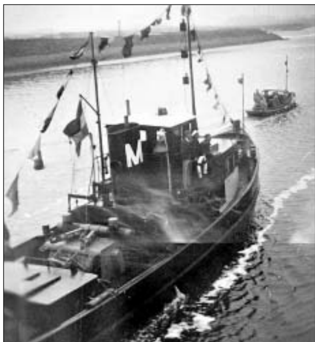
Á veg inn í Amsterdam togaðir av sleipibáti.

16. maí var litíð av arbeiði. Nú er liðugt at