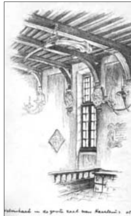
Býráðshöllin í Haarlem í Hollandi er skrydd við lutum úr hvalabeini.

26. januar var arbeitt allan dagin við at lossa ymiska útgerð umborð á "Willem Barendsz". Veðrið var av tí allarbesta. So langt, sum eygað sá, var ísur uttan um okkum. Tað var alt smáur ísur, einkult stór stykkir.