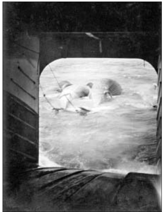
Her ein rættiligur fongur klárur at hiva inn á hekkuna.