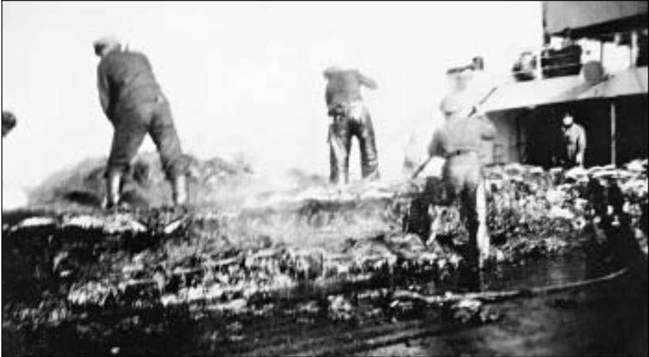
Á fordekkinum verður hvalurin sundurlimaður. Beinini verða skorin sundir við sag. Síðan verða tey koyrd í eina kvørn og síðan kókað.

29. apríl var meiri kraft sett á at mála skipið, um- framt at summir vaskaðu og skravaðu. Eisini er komið væl á veg at reinsa spikpottarnar. Síðani vit fóru frá Cape Town hevur verið eitt fitt lot aftaná. Nú er tað minkað burtur í næstan einki.