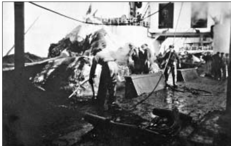
Afturdekkið. Her verða hvalirnir flensaðir.

11. apríl var arbeitt við sama lag. Alt tað ovasta lagið av plankum á dekknum er brotið upp og blakað yvir bord. Mesta fólk- ið arbeiddi við at vaska og skrava. Kl. 2 komu "Am.1", "Am.2" og "Am.7" á borði at fáa sær olju og proviant. Tá teir vóru lidnir, sleptu teir tí rotna hvalinum, teir høvdu