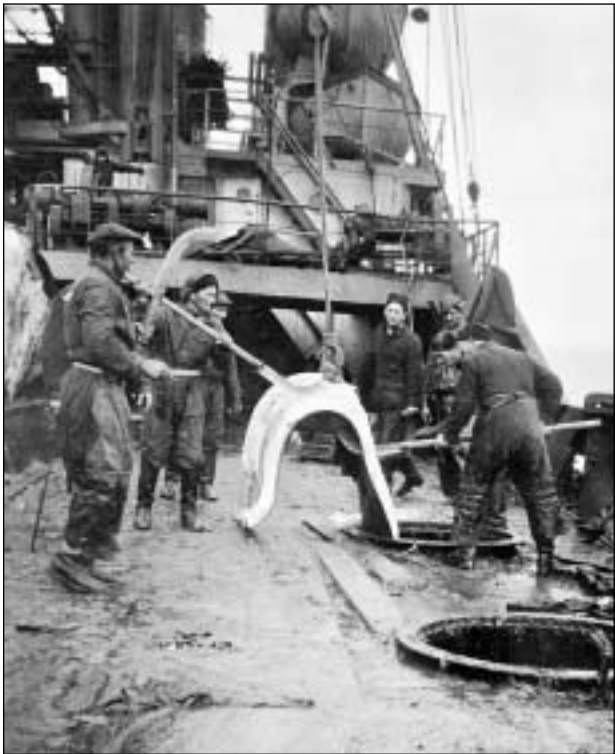
Her verður spik koyrt í pottin á afturdekkkinum. Spikið sær ikki so tjúkt út her, men tað kundi vera ein fót tjúkt.