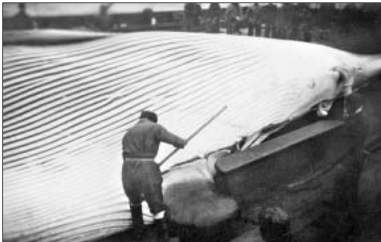
Her verður skorið fyrri at flensa.