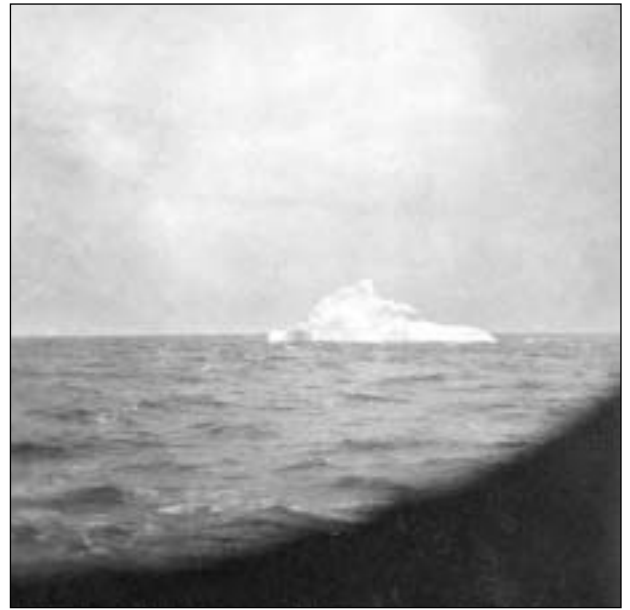
Ísfjöll vóru eisini á leiðini.

25. januar var farið at sigla longur inn í isin. Tankbáturin "Nacella" fylgdi við okkum. Seinnapartin var støðgað. "Am.7" kom við trimum spermum. Teir vóru hongdir til friholt millum skipini. Tað var byrjað beinan vegin at pumpa oljuna umborð.