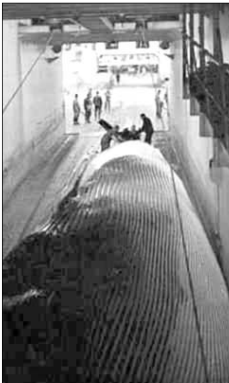
Ein royður fyllir væl upp á dekkinum.