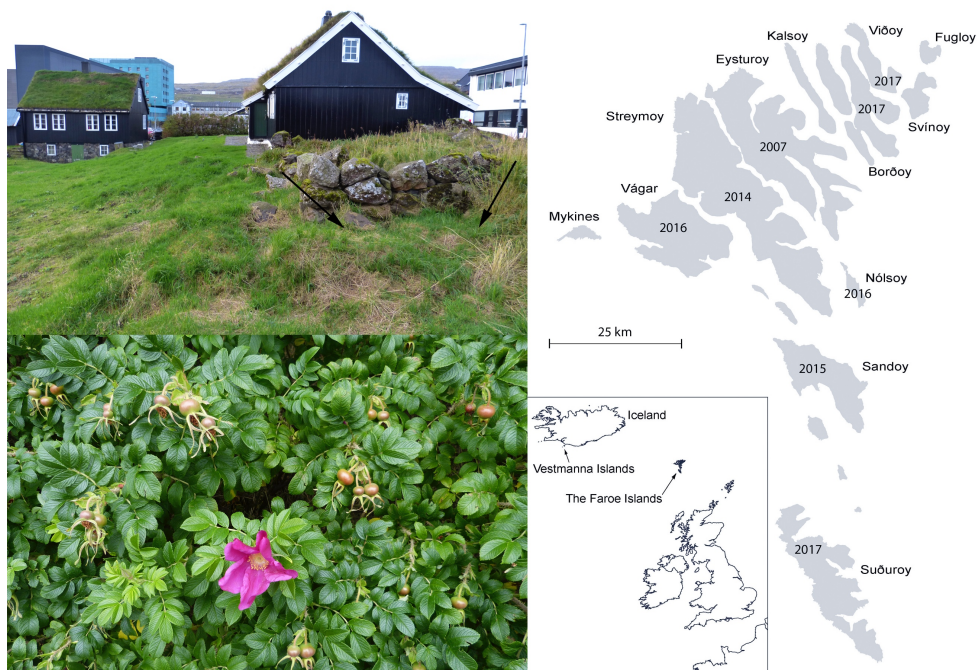
Fig. 2-4. Øvest til venstre. Fund af et Bombus lucorum humlebi-bo på Færøerne, Tórshavn, Streymoy. Nederst til venstre. Rosa rugosa busk med hyben, Nólsoy i 2017. Til højre. Spredningsforløb af Bombus lucorum på Færøerne.

Selv om der i den færøske udmark findes mange blomstrende Vaccinium spp., Empetrum spp. og Rubus saxatilis , ses der kun meget få bær. I de områder hvor Bombus lucorum er udbredt, ses en meget tydelig forandring på Rosa rugosa buskene, som tidligere kun havde meget få eller slet ingen hyben, men som nu hænger med hyben i store klaser (fig. 3). Også træer som guldrejn får nu mange frøbælge i forhold til tidligere. Det må formodes, at artens tilstedeværelse i udmarken også vil påvirke den lokale (vilde) flora her.